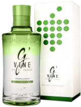
Gin G'Vine Floraison "Grape Dot pack"